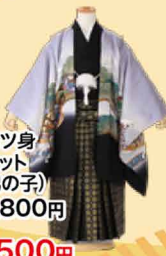
正絹四ツ身羽織セット (5歳男の子) 107,800円 71,500円