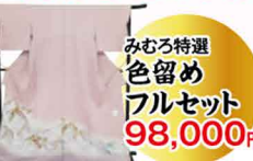
みむろ特選色留めフルセット 98,000円