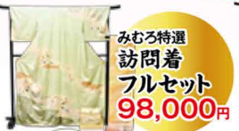
みむろ特選訪問着フルセット 98,000円