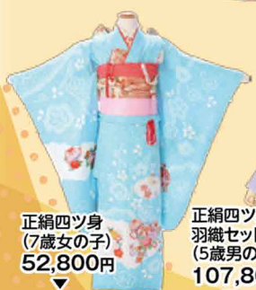
正絹四ツ身 (7歳女の子) 52,800円 31,900円