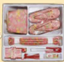
はこせこセット 13,200円 8,800円