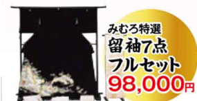
みむろ特選留袖7点フルセット 98,000円