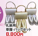
礼装用草履・バッグセット 8,800円