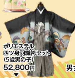
ポリエステル四ツ身羽織袴セット (5歳男の子) 52,800円 30,800円