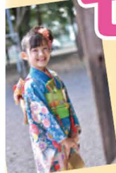
女兒ポリエステル被布コート6点セット (3歳女の子) 13,200円▶ 8,800円